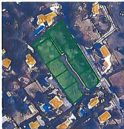
OAP Corzent Impasse des Grives