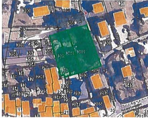
Parking des pêcheurs Place des Jardins Vieux