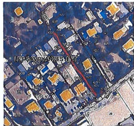
Les Savoyances (derrière les Kinés) Impasse des Busards