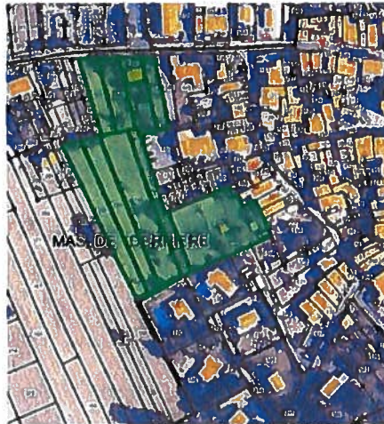
ONYX, rue des Fontaines Impasse des Mazots