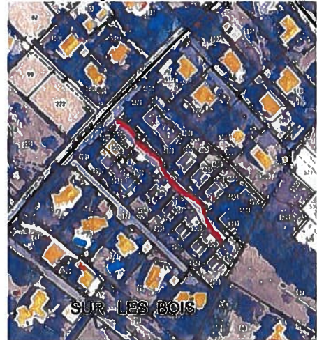
ECRIN LEMAN Impasse des Grèbes