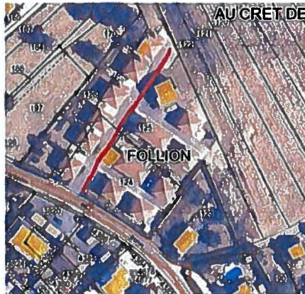
Champ Follion Impasse Champ Follion