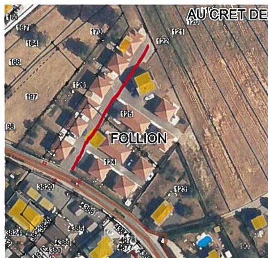
Champ Follion Impasse Champ Follion