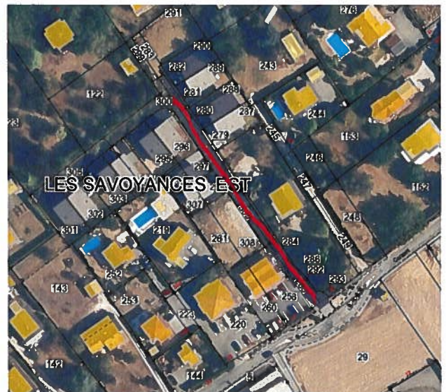
Les Savoyances (derrière les Kinés) Impasse des Busards