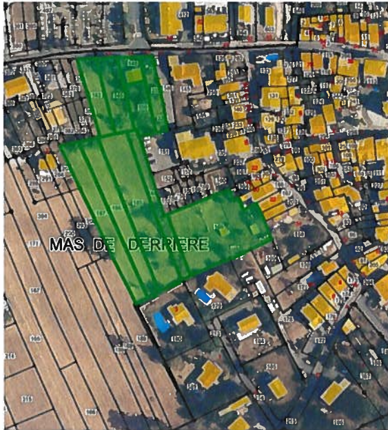
ONYX, rue des Fontaines Impasse des Mazots