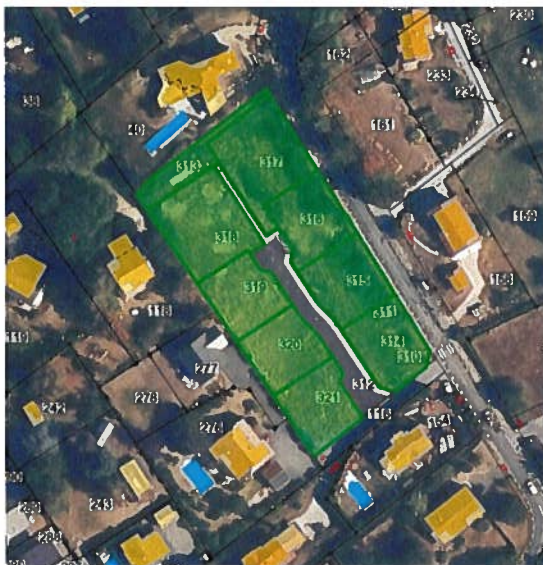
OAP Corzent Impasse des Grives