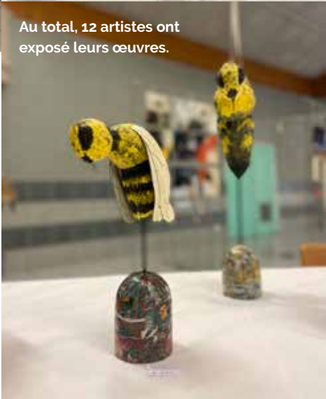
Au total, 12 artistes ont exposé leurs œuvres.