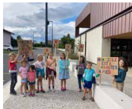
Plus rapide et plus sympa d'aller à l'école à pied ? Des enfants ont fait l'expérience comme l'attestent leurs panneaux. Un moment très sympa qu'ils ont beaucoup apprécié.