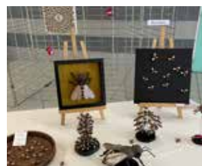
L'Espace du lac a abrité une exposition avec des œuvres originales sur le thème des abeilles.

Une première édition d'une grande qualité, appelée à devenir un rendez-vous annuel. Et qui est un prolongement des actions menées au quotidien par les autorités. En espérant que cette semaine vous ait inspirée, qu'elle ait éveillée votre curiosité et qu'elle vous ait permis de belles rencontres.