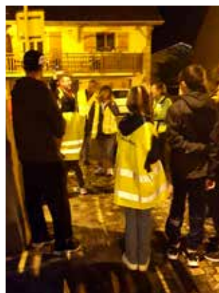
La balade nocturne animée par le collectif «Rallumer les étoiles» a été très appréciée par les participants.