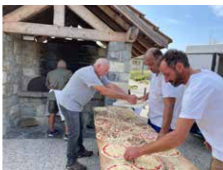
Le four à pain a été allumé pour l'occasion. Beaucoup de succès pour la vente des pizzas dont les bénéfices ont été reversés aux Virades de l'Espoir.