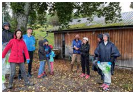
Il pleuvait pour la sortie ramassage des déchets. Il n'empêche, des courageux ont fait preuve de civisme pour nettoyer les plages.

La première édition de la semaine du développement durable du 23 au 30 septembre a suscité l'enthousiasme des participants. Organisée par la Municipalité, les élus et les habitants oeuvrant au sein de la commission Développement durable et au Centre communal d'action sociale, elle avait pour fil rouge «Agir au quotidien». Comme il est mentionné dans l'agenda 2030, «Agir au quotidien», c'est s'engager pour faire évoluer les comportements dans tous les domaines du développement durable.